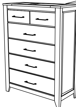
Anti - Tip Kit

Remark : Please be noted that the * safety bracket set with instruction is attached in the right top drawer